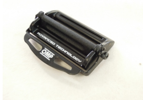
A2-1) Position / Position : Right shoulder and lap strap