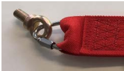
A1-3) Position / Position : Right Pelvic strap