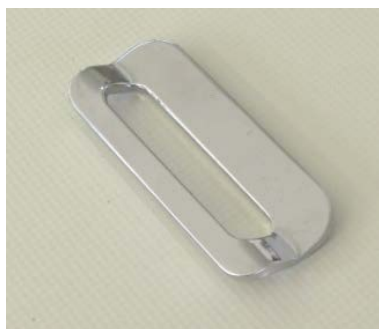
A2-3) Position / Position : Right crotch strap