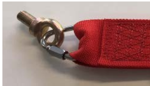
A1-4) Position / Position : Left Pelvic strap