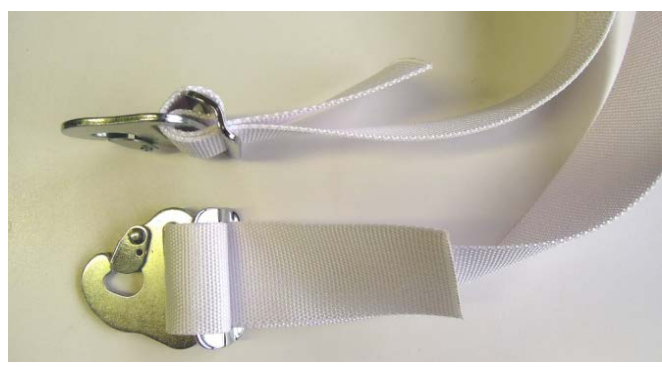
A1-5) Position / Position : Right Crotch strap